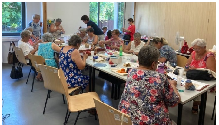
Füzesgyarmati Foltvarró Csoport

bevásárlószatyrokat. Örömmel tapasztaltuk meg, milyen sokan éltek most a lehetőséggel, hogy ennyien részesei lehettek a közös alkotás, az együttműködés lélekemelő élményének. Örömeinkre már hárman jelezték csatlakozási szándékukat. Szeptember 9-től minden második szerdán délután öt órától várjuk az érdeklődőket.