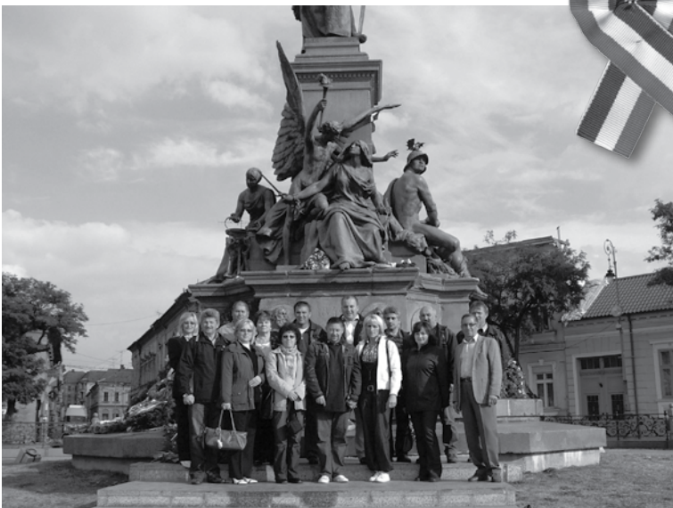
Füzesgyarmat Városának vezetői a 13 vértanú emlékművénél koszorúztak Aradon.