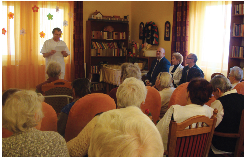
A Szociális Szolgáltató Centrum női ellátottjait és dolgozóit köszöntötték Nőnap alkalmából. 5. oldal

Színesíteni szeretnénk az Amondó lapjait, ezért gondoltuk úgy, hogy hónapról – hónapra más tehetséges fiatal mutatunk be az olvasók számára a helyi újságunkban. 5. oldal